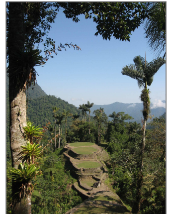
Das Zentrum Teyunas, der "Verlorenen Stadt"

Der Tag gibt Zeit für eine Erkundung der Stadt Teyuna, die zwischen 500 und 700 n. Chr. von der Tayrona-Kultur erbaut wurde und viele Jahrhunderte lang die heiligste Stätte der gesamten Region war. Sie erstreckt sich von 800 bis 1300 Höhenmetern und ist umgeben von vielen Kilometern des höchsten Küstengebirges der Welt. Zahllose Steintreppen bilden ein Netz durch die Terrassen der alten Stadt, die nur zu besonderen Anlässen und Festen besucht wurde. Am Rand der Stätte laden zwei Bergquellen zum Baden ein, in der schon die Tayrona-Indianer Heilung gesucht haben. In intensiven Gruppen- und Einzelcoachings lösen wir alte Muster, Blockaden und Limitierungen, um das volle Potential eines jeden freizusetzen und neue Perspektiven zu schaffen.